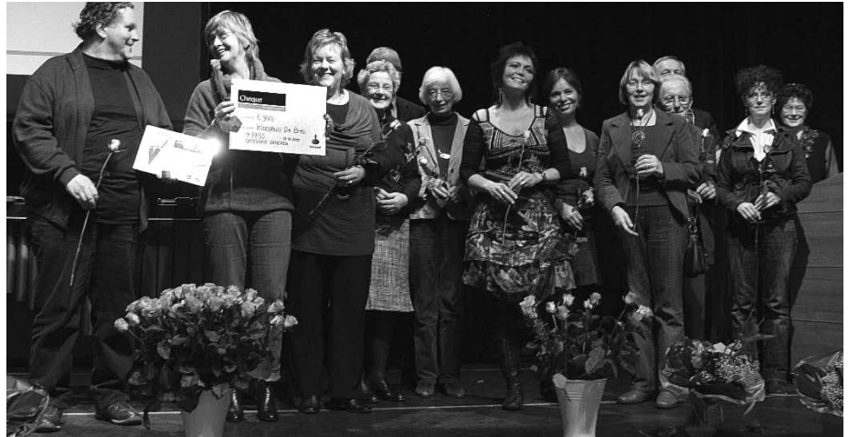
De gastvrouwen en -heren zullen het aan de prijs verbonden bedrag van € 900,- goed besteden.

Een gast van het eerste uur is Riet. Ze is 67 jaar en komt al zeven jaar in De Bres (pag. 2)