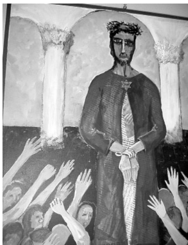
Oldenzaalse kruiswegstatie 'te gast' bij de Bres.