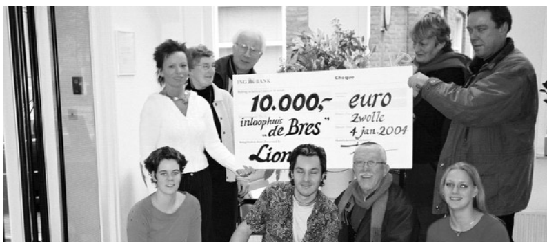
Gasten en vrijwilligers van de Bres met de donatie van de Lions: € 10.000,-

En: het verhaal gaat door. Zondag 4 januari. De Zwolse afdeling van de serviceclub Lions heeft haar jaarlijkse nieuwjaarsconcert dit keer in een ander jasje gestoken. In plaats van het klassieke genre staat de Zwolsche Muziekfabriek op het programma in de Nieuwe Buitensociëteit. Zal de formule aanslaan?